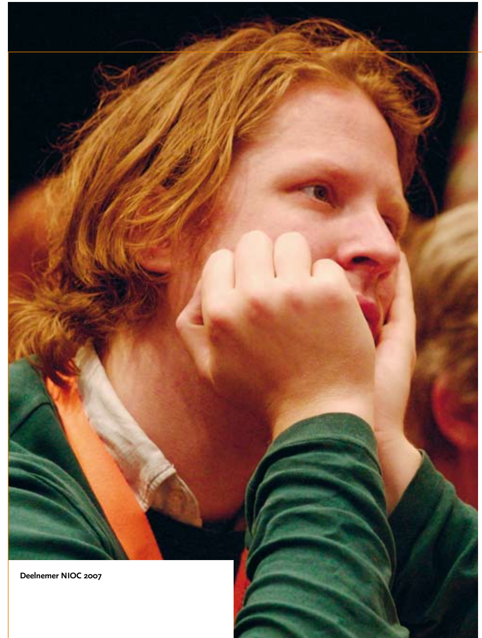
Deelnemer NIOC 2007

Voor docenten is het verleidelijk, moeilijk grijpbare begrippen vast te spijkeren in definities. Reproductiegerichte leerlingen krijgen dan de neiging, alles aan de definities van hun meester te meten. Dit bevordert het begrijpen niet. Bovendien hanteren verschillende auteurs verschillende definities voor dezelfde termen, d.w.z. ze gebruiken dezelfde term voor uiteenlopende concepten. In de informatica zijn bijv. begrippen als