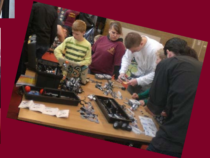
Vind samen met Zuyd Robotics de weg NIOC 2011 - R. Verheijen