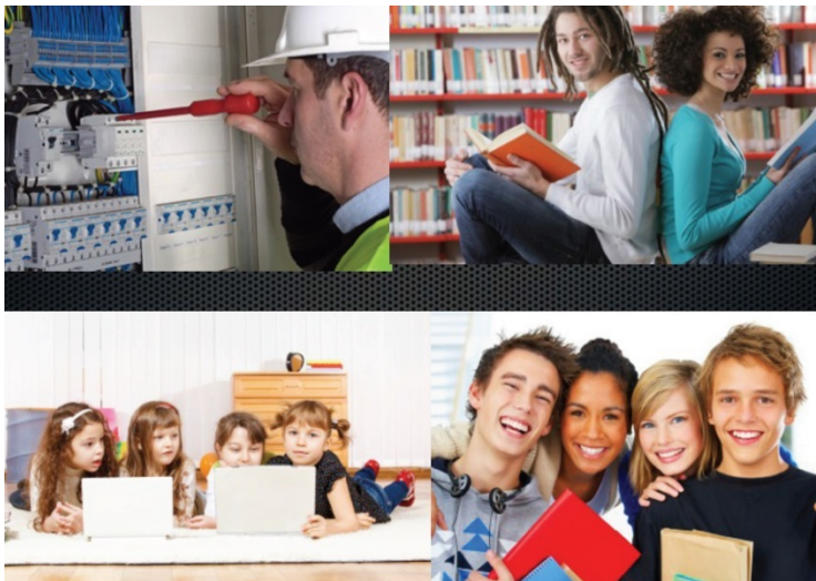
Figuur 1. Studeren met ICT op alle onderwijsniveaus.

Leren met ICT is voor alle niveaus van het onderwijs bruikbaar, nuttig, zinvol én verschilt op elk van die niveaus en mogelijk eveneens binnen elk vak en bij elke context (figuur 1).