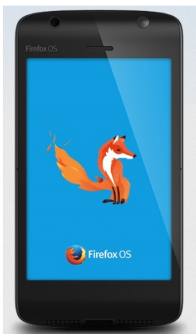
Figuur 2. Firefox OS voor mobile phones.

Doordat web-apps over het algemeen vrij uitgebreide webapplicaties zijn, lenen ze zich goed om studenten te oefenen met event-driven-programmeren, en vooral ook met een modulaire opzet: een lagenstructuur. Juist bij web-apps is het daardoor van belang om netjes te programmeren in JavaScript.