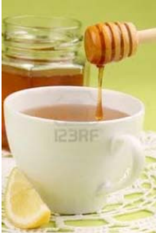
Figuur 4. Thee met honing.