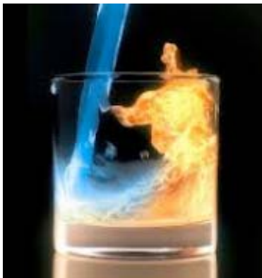
Figuur 1. Water en vuur.

In dit artikel wordt ingegaan op twee experimenten om dat water en vuur toch met elkaar te verenigen.