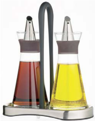
Figuur 3. Olie en azijn.

Kort door de bocht gezegd zijn de projectleden bij de onderzoeker op bezoek. De onderzoeker is vooral klant. Er is een duidelijke rolverdeling. Het doel van het project is duidelijk. Vanuit de proeve van bekwaamheid karakter worden hoge eisen gesteld aan de documentatie. Er is overleg met de onderzoeker over vrijheidsgraden. De studenten maken kennis met het onderzoek van de onderzoeker en met de onderzoekomgeving van de onderzoeker. Hun resultaat maakt nieuw onderzoek mogelijk en ze verkennen zelf welke nieuwe mogelijkheden dit geeft. Hiermee bereiden ze zich ook voor op de keuze voor een master. Al met al is het resultaat geen water en vuur maar meer olie en azijn (zie figuur 3). Het vergt enig kloppen om het te mengen maar het brengt het gerecht op een hoger smaakniveau.