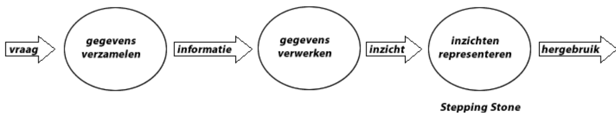
FIGUUR 1: DE ONDERZOEKSCYCLUS IN EEN STROOMDIAGRAM

Om dit te verhelderen is het misschien goed de plek van de stepping stones in het onderzoeksproces weer te geven. Figuur 1 geeft de onderzoekscyclus voor de uitvoering van één methode in een stroomdiagram neer.